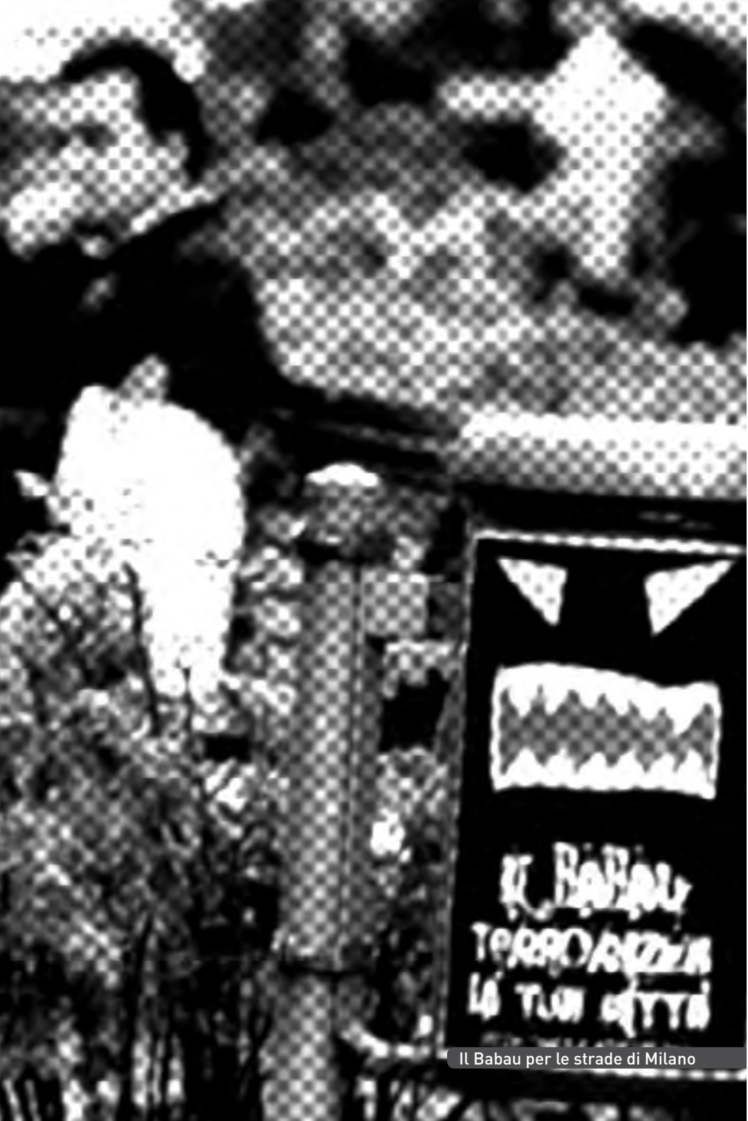
Il Babau per le strade di Milano