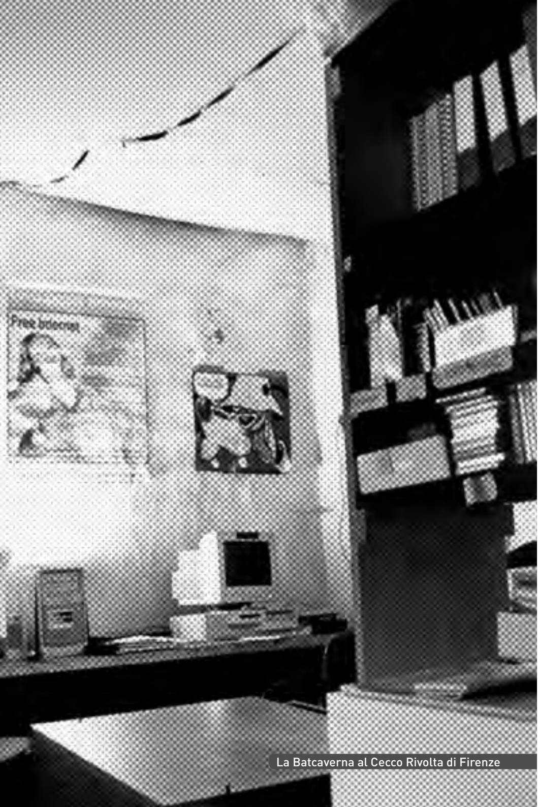
La Batcaverna al Cecco Rivolta di Firenze