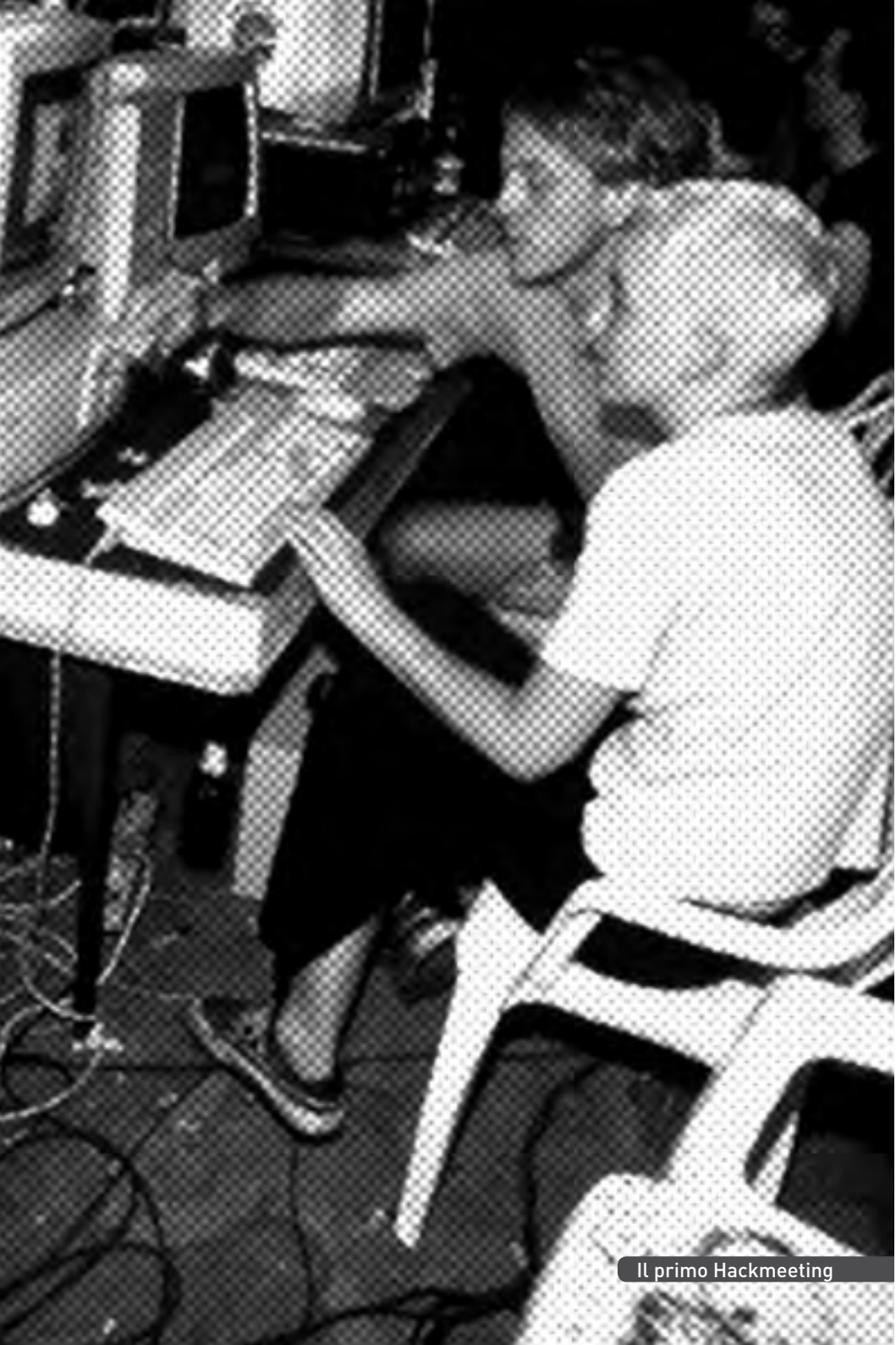
Il primo Hackmeeting