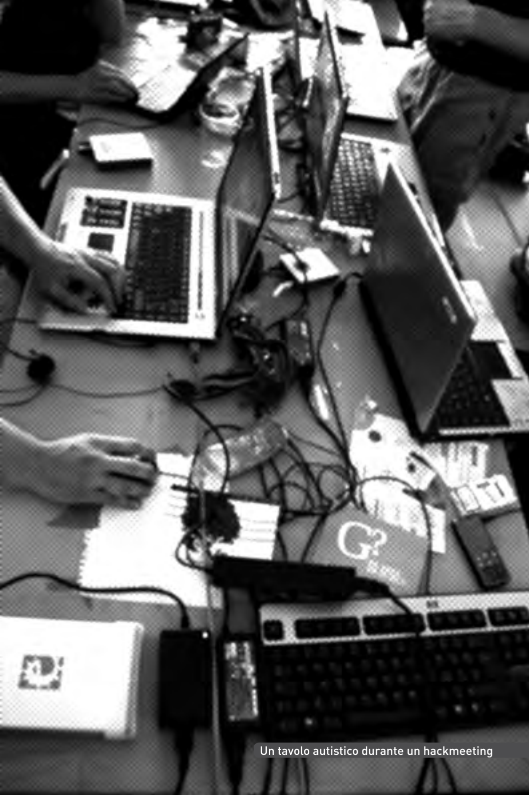
Un tavolo autistico durante un hackmeeting