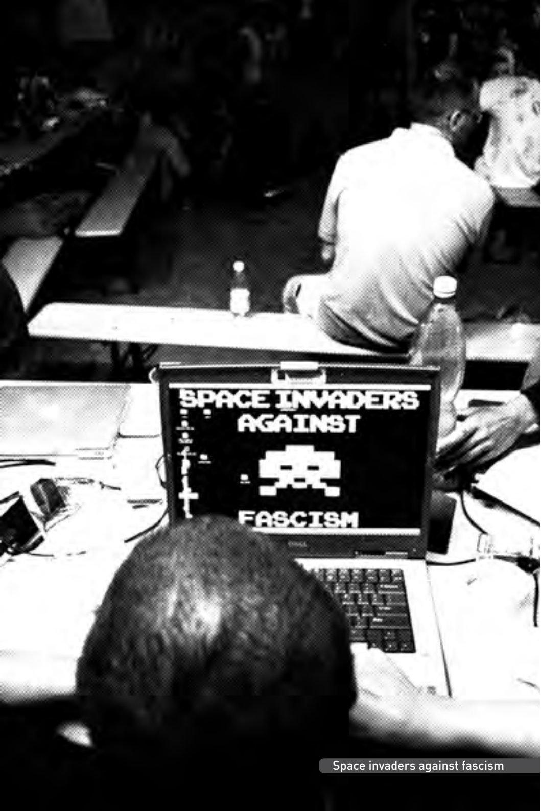
Space invaders against fascism