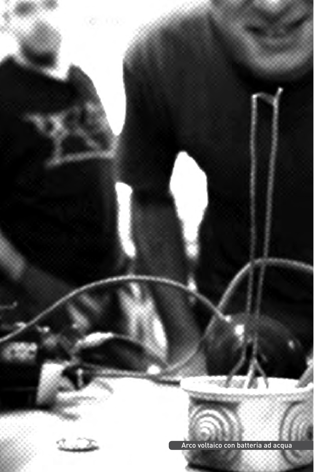
Arco voltaico con batteria ad acqua